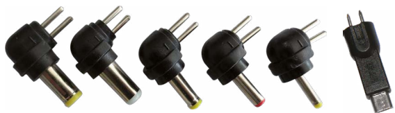
5,5x2,5mm - 5,5x2,1mm - 4,0x1,7mm - 3,5x1,35mm - 2,35x0,75mm - Micro USB

AP225 è un alimentatore switching multi tensione con ingresso 110-240V AC dotato di 6 connettori d'uscita intercambiabili utilizzabili per alimentare i più diffusi dispositivi elettronici.