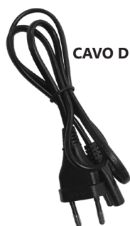
CAVO DI RETE