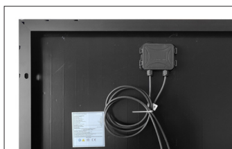
SCATOLA DI GIUNZIONE E CAVI INCLUSI

Certificazione IEC / EN 61215 IEC / EN 61730