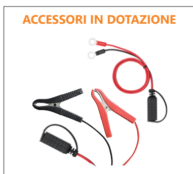
ACCESSORI IN DOTAZIONE