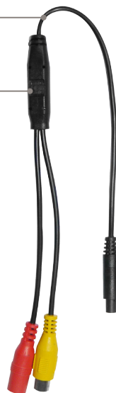
PULSANTE DI REGOLAZIONE DELLA TELECAMERA